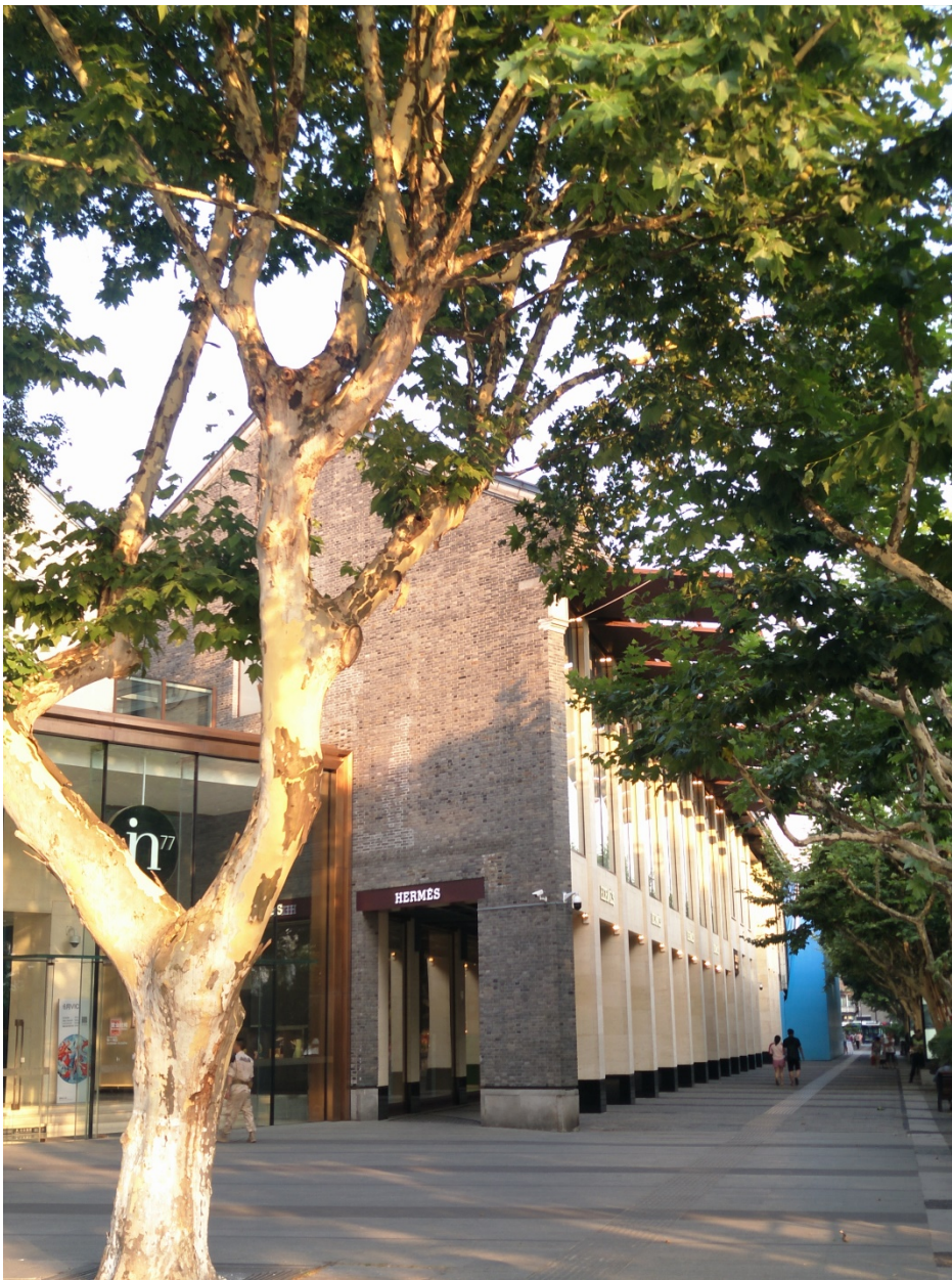
Titel: Store des Luxus-Labels an der angesagten Uferpromenade des West Lake in Hangzhou

Presse-Fotos: Auf Anfrage marketing@oli-lacke.de