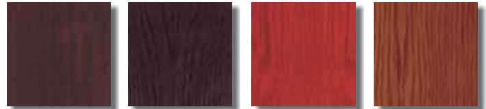
Wenge | Wenge