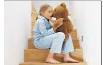
OLI LACKE | Möbel & Treppe