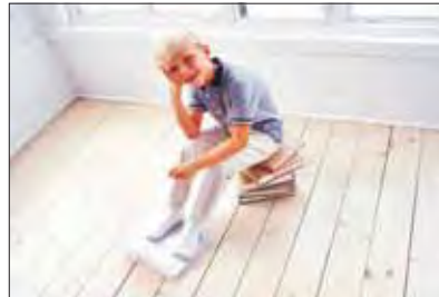
OLI NATURA | Öle & Wachse