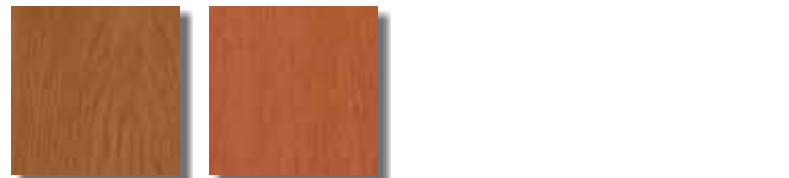
Teak | Teak