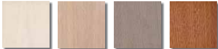
Polar Weiß | Polar white