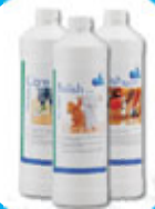
Reinigung & Pflege