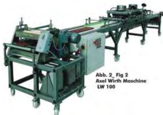
Abb. 2 _ Fig 2 Axel Wirth Maschine LW 100

In interplay with the evenly thin roller application amounts and the rotating