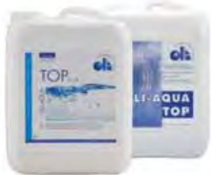
Neue und alte Optik

Im verjüngten Design möchten sich auch die übrigen OLI-AQUA Oberflächenschutzsysteme zeigen. Die Gebindeetiketten werden deshalb in der ersten Jahreshälfte 2009 ein Facelifting erhalten.